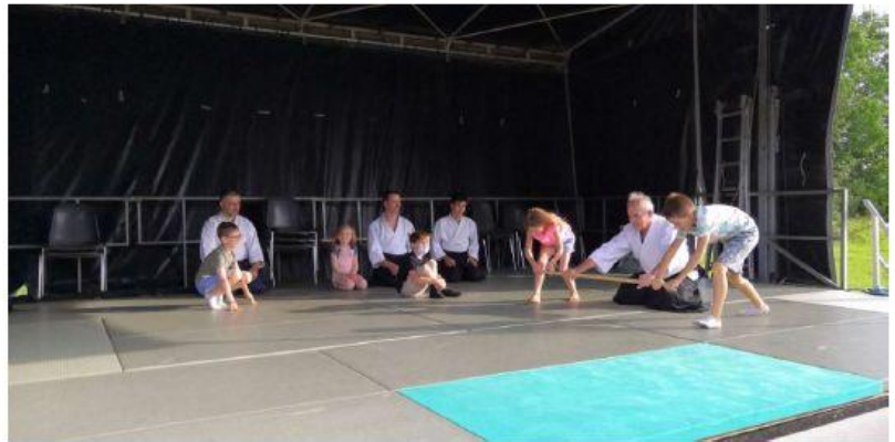
AIKIDO A.G.ordinaire novembre 2021