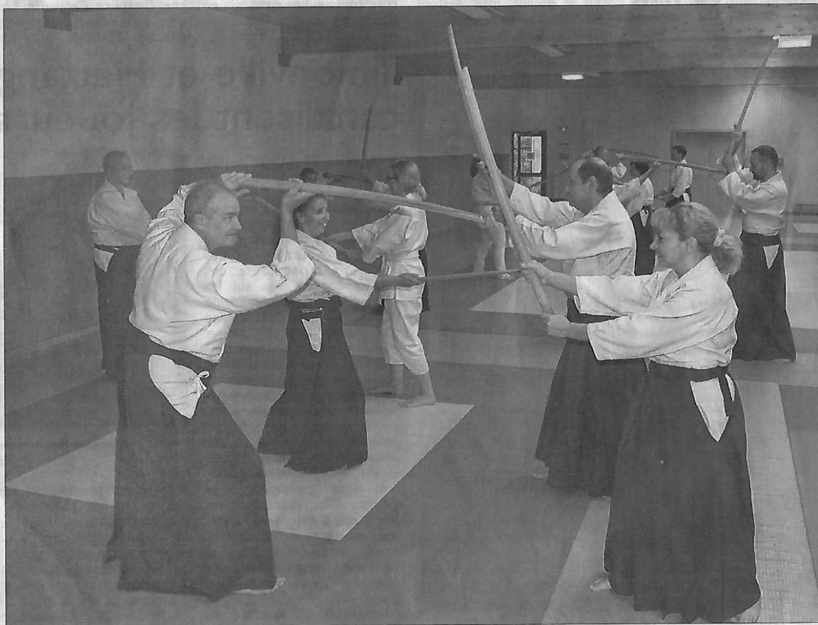
Bien qu'art martial, l'aïkido est aussi l'art de la paix !

Renseignements auprès du secrétariat : Antoinette Tél. 07 70 66 16 15.